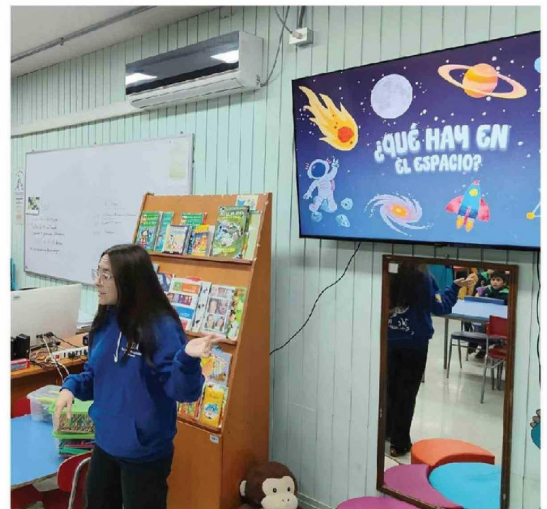
ESTUDIANTES PARTICIPARON en talleres interactivos donde aprendieron sobre gravedad, galaxias y fenómenos astronómicos mediante experiencias prácticas y material didáctico.

La decisión de convertirse en sede oficial del evento este año responde a una estrategia educativa a largo plazo. Tras una exitosa visita previa a las dependencias de la Universidad de Concepción el año anterior, la comunidad educativa del