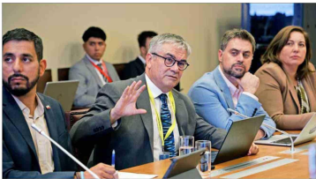
Mario Marcel ayer acudió como invitado a la comisión de Hacienda de la Cámara de Diputados.