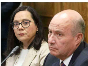
La semana pasada, la presidenta del CFA, Paula Benavides, y el ministro de Hacienda, Jorge Quiroz, coincidieron en la reunión del Senado.

última etapa de la tramitación de la reforma previsional en el Senado, se asume que el organismo revisará en detalle los números del informe financiero de la Dirección de Presupuestos (Direpres) y las compensaciones por la merma en ingresos fiscales que traerán las rebajas. Esto podría presionar a realizar modificaciones adicionales en los mecanismos compensatorios para no ampliar las cifras de déficit fiscal (ver B 2). Anticipándose a este escenario, en el Ejecutivo, hasta última hora, han seguido afinando el diseño de los ajustes paliativos a