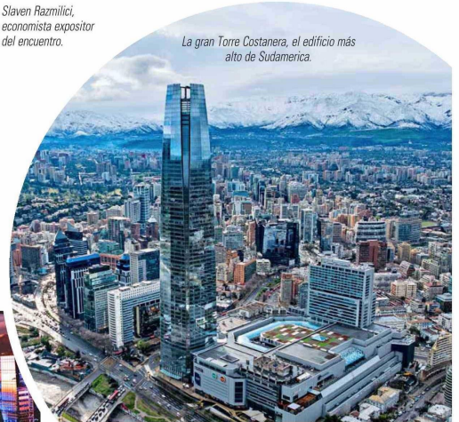
La gran Torre Costanera, el edificio más alto de Sudamérica.