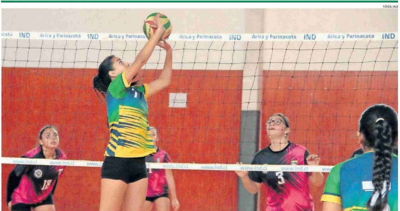
DISPUTADAS ESTUVIERON LAS SEMIFINALES DEL VÓLEIBOL ESCOLAR FEMENINO DE LOS JUEGOS DEPORTIVOS ESCOLARES EL SEXTETO CAMPEÓN REPRESENTARÁ A ARICA EN LOS JUEGOS NACIONALES.

Tiraje: 7.300 Lectoría: 21.900 Favorabilidad: No Definida