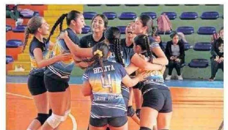
EL GANADOR DEL VIERNES SACARÁ PASAJES PARA SANTIAGO.

La final está programada para el próximo viernes 23 de mayo, en el Fortín Sotomayor, a partir de las 13:15 horas, luego de que se realice el encuentro por el tercer lugar que comenzará a las 12:00 horas.