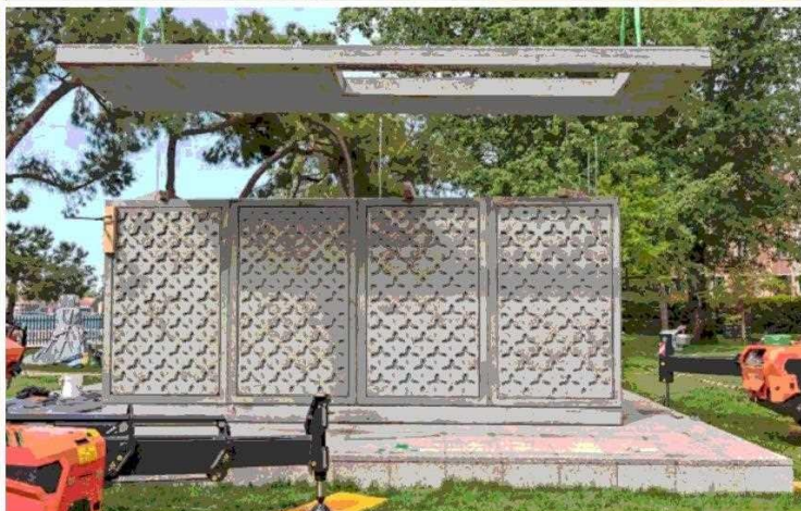
Las perforaciones responden a una estrategia de diseño para disminuir el peso del material exigido por la organización.

estructura, las zonas húmedas, los sanitarios, el muro contrafuego, la aislación acústica, la relación con el vecino. Hemos tratado de evangelizar con la idea de incrementalidad aquí y en la quebrada del ají. De alguna manera aprovechamos este escenario para volver a hacer esto lo más radicalmente posible”.