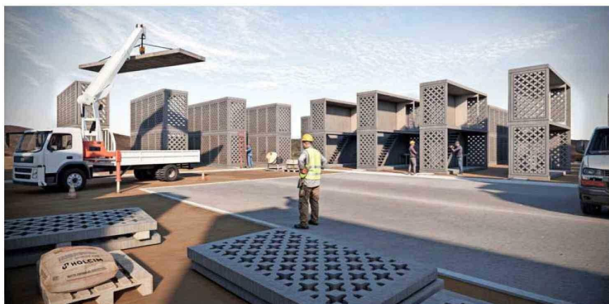
La producción de biocarbón se destinaba a filtros de agua. Hoy hay una mayor cantidad de proveedores, e incluso Holcim evalúa autoabastecerse.

Texto, Pablo Andulce Troncoso.