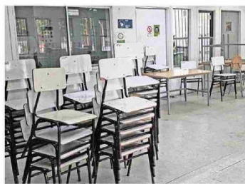
La escuela Cristóbal Colón es una de las modulares.

a la espera del diagnóstico que arroje el estudio de red, que comenzará durante las próximas semanas".