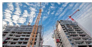
En 2025 se iniciaron 82 obras relacionadas a proyectos de departamentos, lo que representó una baja de 38% anual.

El ejecutivo advirtió que "un elemento clave será el avance en permisología. Por ejemplo, la prórroga de más de 50 mil permisos de edificación que están próximos a vencer es una medida crítica. Sin esa extensión, muchos proyectos tendrían que reiniciar completamente su tramitación municipal, lo que generaría un fuerte cuello de botella".