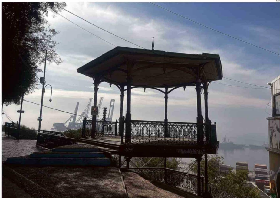
DIRECCIÓN DE OBRAS MUNICIPALES ESTÁ REALIZANDO UN ANÁLISIS ESTRUCTURAL DE LA PÉRGOLA PARA DETERMINAR SUS CONDICIONES.

“Cuando estaba el ascensor llegaba siempre gente, más gente de lo que llega ahora, bastante más en realidad, porque el ascensor aparte de ser un medio de transporte era un atractivo turístico”, co-