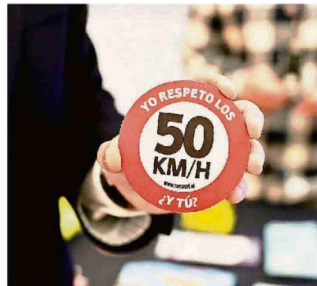
LA FERIA BUSCÓ FORTALECER LA CONCIENCIA VIAL Y PROMOVER EL AUTOCUIDADO ENTRE LA CIUDADANÍA.