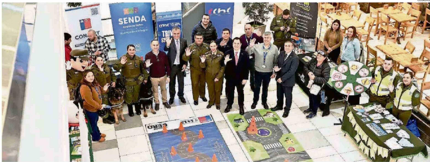
AUTORIDADES REGIONALES PARTICIPARON EN LA PRIMERA FERIA DE SEGURIDAD VIAL REALIZADA EN ÑUBLE.