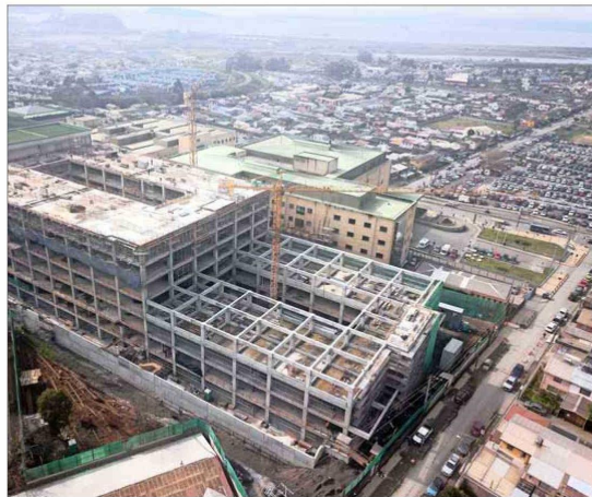
El Hospital Las Higueras (en la foto) es uno de los que actualmente está desarrollando la constructora Moller y Pérez-Cotapos.

“El propósito del aumento de capital es fortalecer financieramente a la compañía, permitiéndole afrontar de manera más efectiva los retrasos de los pagos por parte de los mandantes de obras hospitalarias del Ministerio de Salud, así como en los procesos de aprobación municipal de proyectos inmobiliarios. De esta forma, la empresa estará en una posición sólida para aprovechar nuevas oportunidades de negocios a lo largo del año 2024”,