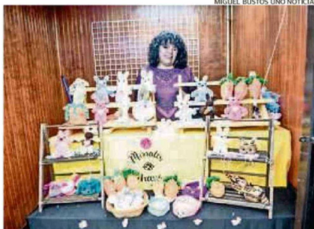
LA FERIA DE CHOCOLATES ESTÁ EN EL PASEO CAMILO HENRÍQUEZ.

En el marco de Semana Santa es que la Municipalidad de Valdivia también puso en funcionamiento el “Paseo del chocolate”. Es una tradicional feria de emprendedores locales ubi-