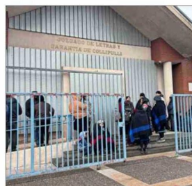
COLLIPULLI. — Hasta el tribunal llegaron familiares de los miembros de Temecucui.

En tanto, los otros dos casos fueron detenciones en flagrancia. Se trata de A.H.O.A. (hombre, 29), con causas por manejo en estado de ebriedad, porte de arma cortante y consumo de drogas, y de M.D.Q.H. (mujer, 41), con antecedentes por oponerse a la acción de la autoridad, usurpación de propiedad y maltrato de obra a carabineros.