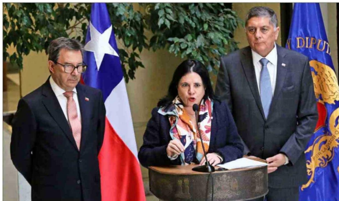
RESPALDO A MINISTRA. — El titular de Defensa, Fernando Barros (derecha), destacó la coordinación que realizó su par de Seguridad, Trinidad Steinert, en el operativo. En la foto, junto al jefe de Interior, Claudio Alvarado.

Steinert explicó que la formalización de los detenidos se realiza “en atención a una investigación realizada desde 2025, por los delitos de robo con violencia, incendio y disparos injustificados”. Destacó que durante el desarrollo de las acciones no hubo carabineros lesionados, pero aclaró que