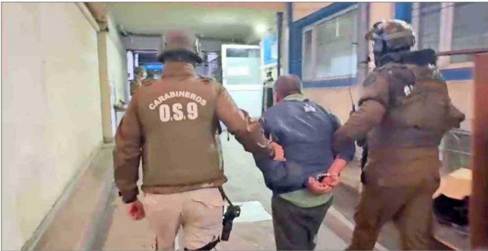
ATAQUES EN LA PRINCIPAL CARRETERA DEL PAÍS. — La indagatoria contra los miembros de la comunidad Temecucui los vincula con atentados en la ruta 5 Sur, entre otros ilícitos.