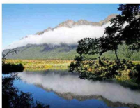
Isla del Sur, Nueva Zelanda.