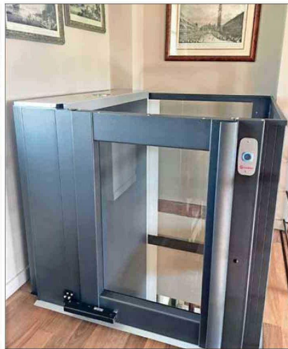
La accesibilidad se logra al diseñar soluciones integrales.

que aún existe una distancia importante entre lo que exige la norma y lo que efectivamente se implementa en los proyectos.