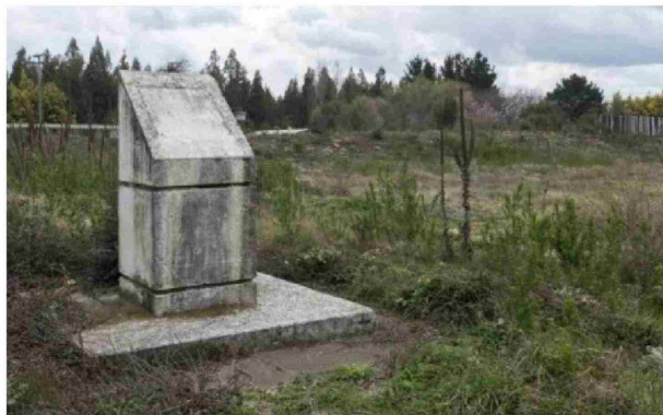
EL PROYECTO DE RECUPERACIÓN busca rescatar la memoria histórica de la Conquista y la Colonia en la provincia.

"Nos vamos muy contentos de haber logrado la