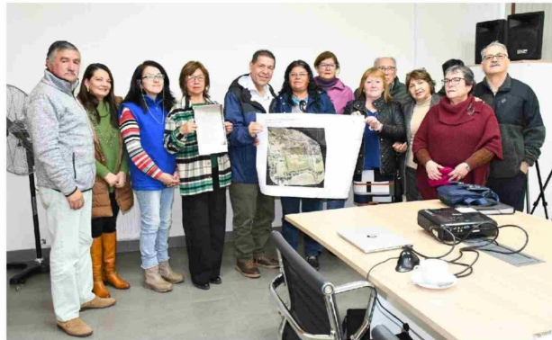
EL ALCALDE JAIME VELOSO celebró la concreción del terreno junto a vecinos y el Comité de Apoyo al Fuerte.

La iniciativa busca transformar el sitio en un referente turístico y cultural que fortalezca la identidad comunal, rescatando la memoria histórica de uno de los períodos más significativos de la región.