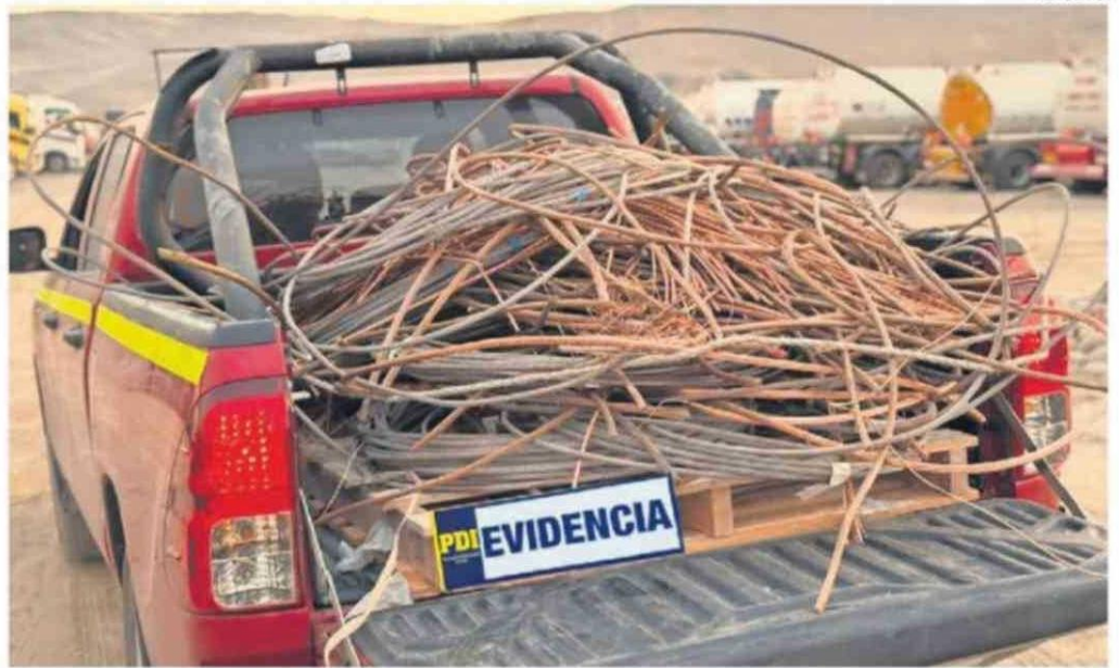
PARTE DEL MATERIAL INCUATADO EN ESTE OPERATIVO.

A través del trabajo investigativo se logró ubicar el vehículo, y se constató que, bajo una carga de juguetes y ropa usada, se ocultaba una