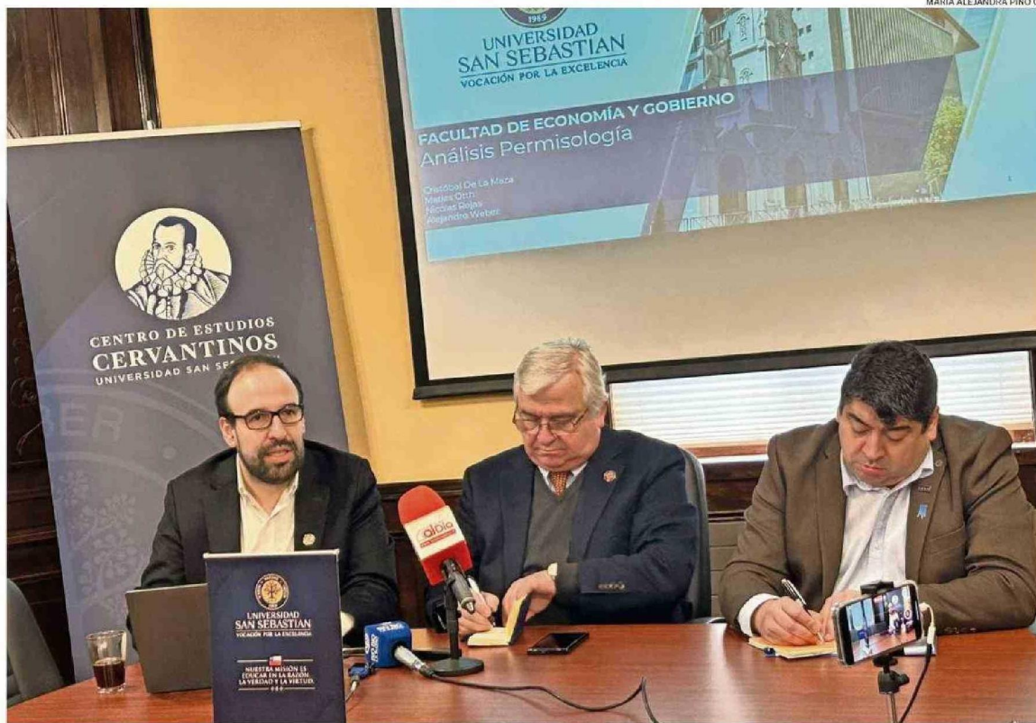
AYER, EN LA SEDE VALDIVIA DE LA UNIVERSIDAD SAN SEBASTIÁN FUERON REVELADAS CIFRAS NACIONALES Y REGIONALES EN TORNO A LA PERMISOLOGÍA.

ANÁLISIS. Investigación de la USS y de la Cámara Chilena de la Construcción revelaron cifras “que preocupan” e “impactan en desarrollo” de la región, señalaron desde ambas instituciones.