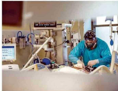
RESOLUCIÓN DE ESTAS LISTAS ES UNA DEMANDA COMPARTIDA.

“De acuerdo a la información de la subsecretaría de Redes, son cerca de 800 mil millones de pesos que se requieren para resolver las listas de espera quirúrgicas y de atención por especialidad. Esta cifra lógicamente es una cifra elevada y que desde nuestra perspectiva requiere ser enfrentada de manera planificada y establecer un acuerdo país de cuánto es el tiempo máximo de espera que debiéramos establecer para cada paciente, para cada patología, tanto en consulta de especialidad como en cirugía, y establecer un plan”, aseveró el representante local del Colmed.