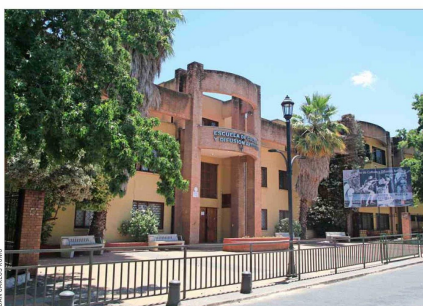
La Escuela de Cultura y Difusión Artística de Talca es uno de los tres Bicentenario que hay en Talca.

Respecto de las expectativas que existen sobre el próximo gobierno, Campos afirma que