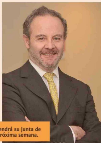
Latam Airlines tendrá su junta de accionistas la próxima semana.