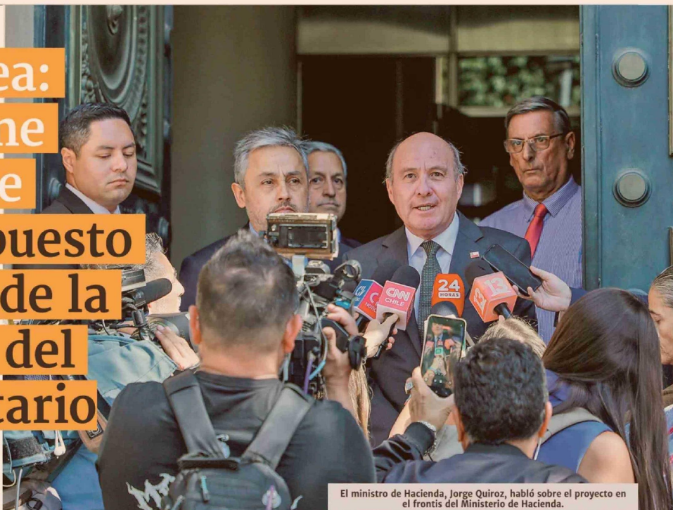
El ministro de Hacienda, Jorge Quiroz, habló sobre el proyecto en el frontis del Ministerio de Hacienda.

■ Hacienda también analiza una fórmula para que contribuyentes puedan retirar el saldo del FUT acumulado, para incentivar la inversión y aumentar la recaudación.