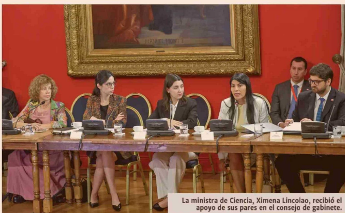
La ministra de Ciencia, Ximena Lincolao, recibió el apoyo de sus pares en el consejo de gabinete.

En paralelo, la reintegración del sistema tributario también sería gradual. Se está definiendo la fórmula aritmética para separar en