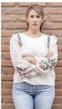
LA ABOGADA GUAREQUENA GUTIÉRREZ FUE EMBAJADORA DE VENEZUELA EN CHILE, ENTRE ENERO DE 2019 Y JUNIO DE 2020.

-¿Qué le ha parecido la actitud del gobierno de Estados Unidos?