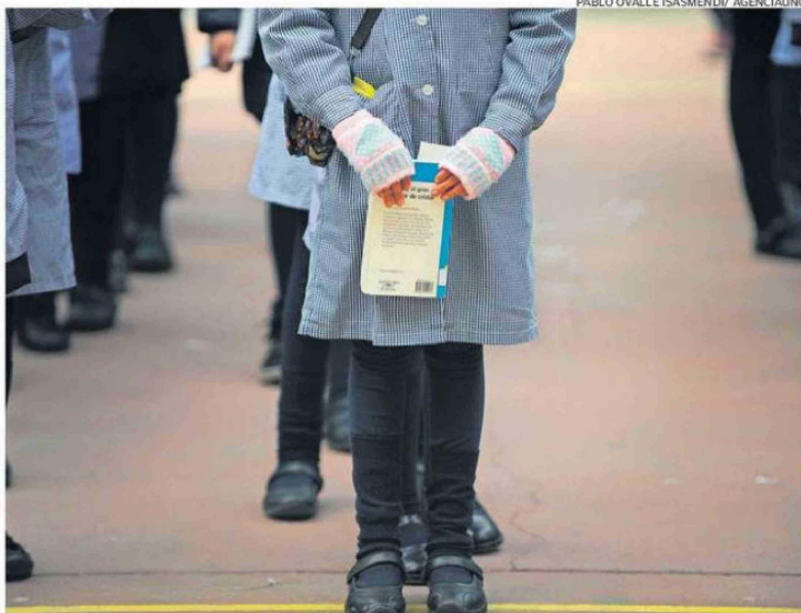
LA EDAD PROMEDIO DE LOS DIRECTORES ESCOLARES EN CHILE AUMENTÓ SOLO DOS AÑOS EN UN DECENIO.

Este recambio parcial plantea desafíos significativos para el liderazgo escolar. Los directores más jóvenes suelen enfrentar mayores exigencias en términos de legitimidad de la autoridad, gestión de equipos intergeneracionales y conducción de comunidades educativas atravesadas por cambios