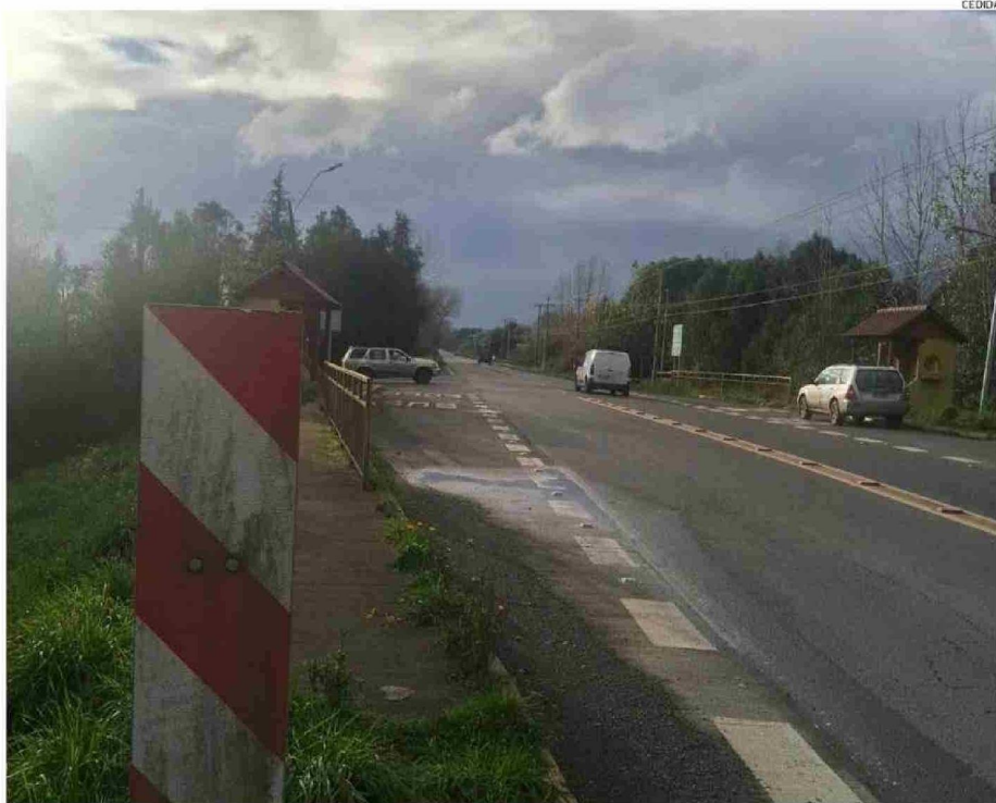
LA RUTA TIENE VARIOS PUNTOS CRÍTICOS EN CRUCES QUE SON MUY PELIGROSOS DE ENFRENTAR.

"Ahora en esta época uno se da cuenta de ello, porque en verano uno llega a la casa con