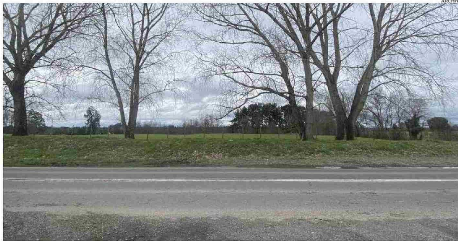
USUARIOS ACUSAN QUE TAMPOCO EL PAVIMENTO ES EL MÁS ADECUADO PARA EL ALTO TRÁFICO DE ESTA VÍA.

en estas décadas se sitúa el estándar con que fue construida esta carretera, que pertenece a la Ruta Interlagos y cuyo trazado no se planificó para adecuarla a las futuras necesidades.