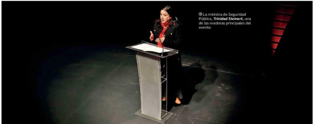
© La ministra de Seguridad Pública, Trinidad Steinert , una de las oradoras principales del evento.

Además de la secretaria de Seguridad, que defendió su gestión y adelantó detalles del plan de gobierno contra el crimen organizado, el evento "Chile en la encrucijada de seguridad nacional", producido por este diario y el Banco de Desarrollo de América Latina y el Caribe (CAF), contó con la participación de exautoridades de Colombia, España y Chile. A la jornada, realizada en el Teatro CA660, asistieron exministros, parlamentarios y diversas personalidades del mundo público y privado.