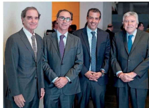
© Hernán Larrain , exministro de Justicia; Raúl Figueroa , exministro de Educación; Rodrigo Delgado , exministro del Interior; y Alberto Espina , exministro de Defensa.