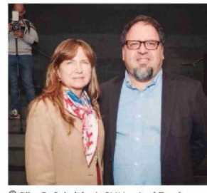
© Pilar Dañobeitía , de SMU; y José Tomás Palma , director ejecutivo de Fundación CorpArtes.