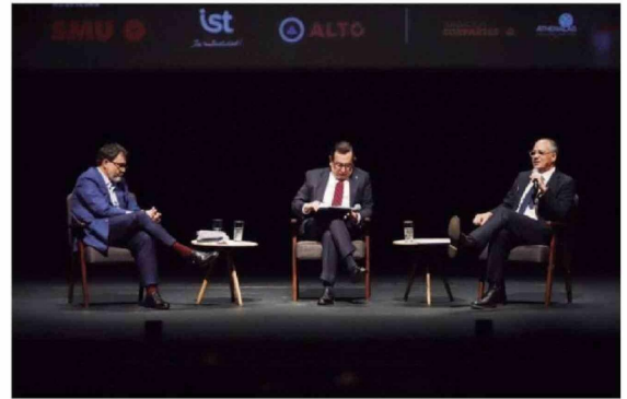
© El seminario "Chile en la encrucijada de seguridad nacional", organizado por La Tercera y el Banco de América Latina y el Caribe (CAF) se realizó en el teatro Corpantes.