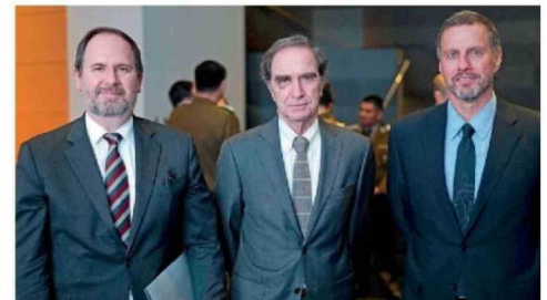
© Julián Suárez , Hernán Larrain y Jorge Andrés Saleh , presidente de Grupo Copesa.