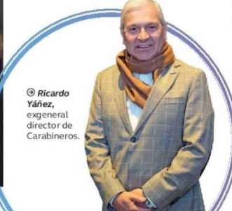
© Ricardo Yáñez , exgeneral director de Carabineros.