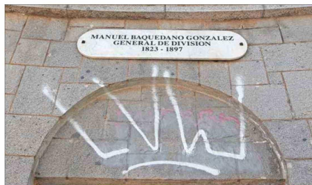
ROBOS. — Entre los distintos actos de vandalismo que han afectado a la estructura está el robo de elementos y placas de mármol.