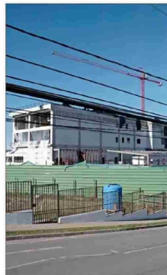
HOSPITAL CONSTITUCIÓN. —Anunciado por el Presidente Piñera, tiene 71,9% de avance.

También expresó que “la hospitalización de menores con trastornos mentales no tiene ningún asidero objetivo, más allá de ser una buena idea que ojalá pudiera ocurrir, esto implica destinar recursos con los que