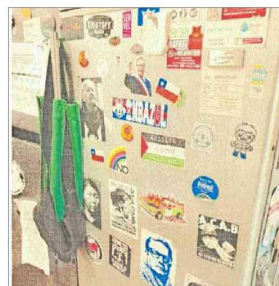
Imágenes de naturaleza política pegadas en la cocina de la casa de uno de los estudiantes indagados por violencia estudiantil.