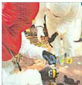
Imputados guardaban en teléfonos evidencias de molotov que sirvieron de pruebas en su contra en investigación penal.