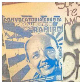
Archivos recuperados en domicilios de estudiantes en apoyo a libertad de exfrentista, en el marco de un caso por violencia escolar.

Lo anterior ha estado acompañado de operativos tanto de captura de prófugos como otros destinados a controlar inmigración ilegal. También están en carpeta planes para reforzar carreteras, fronteras e inteligencia.