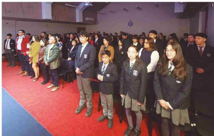
→ Semana de la Educación Artística en el Colegio Inglés Saint John.