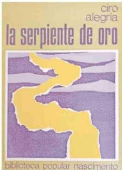
Portada de una de las últimas impresiones realizadas por la editorial Nascimento de la primera novela de Ciro Alegria.