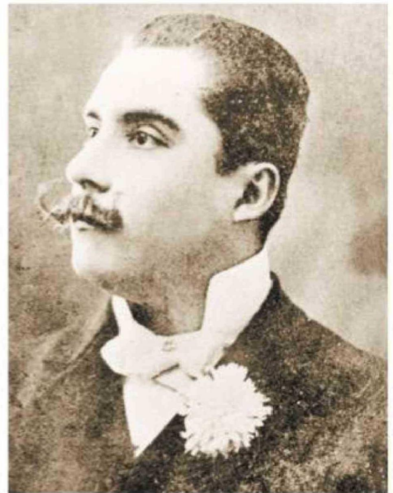
Una de las imágenes más conocidas de José Santos Chocano (1875-1934), prolífico autor peruano fallecido trágicamente en Chile.

En los seis años que duró su estadía en Chile, Santos Chocano vivió con gran austeridad, a menudo con di-