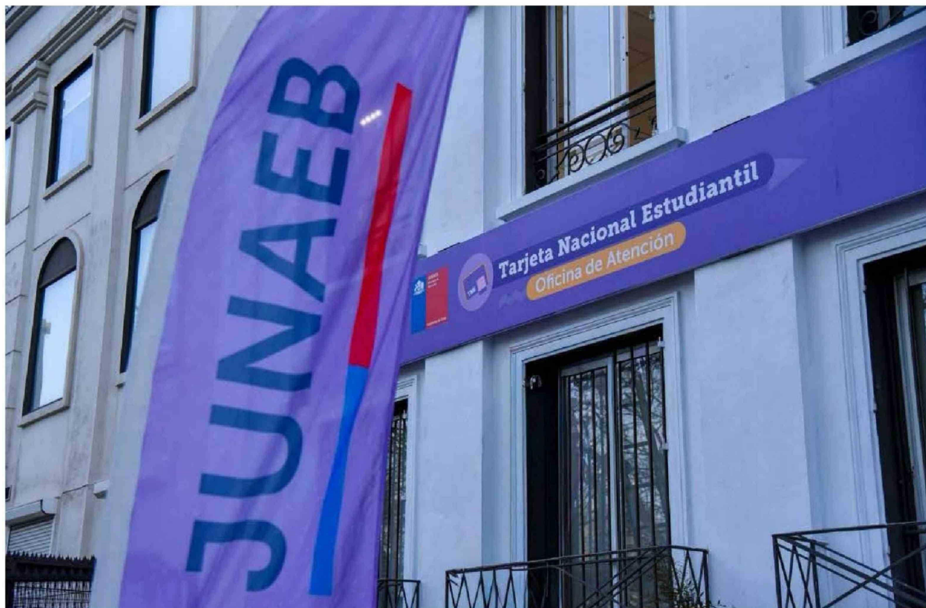
► También se instruyeron investigaciones particulares y derivaciones en casos de hallazgo a otros tres ministerios.