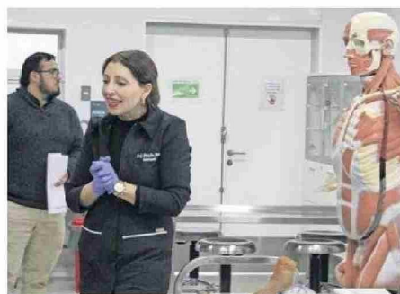
UNA DE LAS DOCENTES ENTREGANDO CONOCIMIENTO.