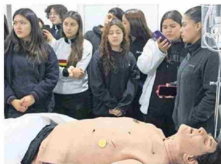
ESCUCHARON CON ATENCIÓN LAS INDICACIONES.