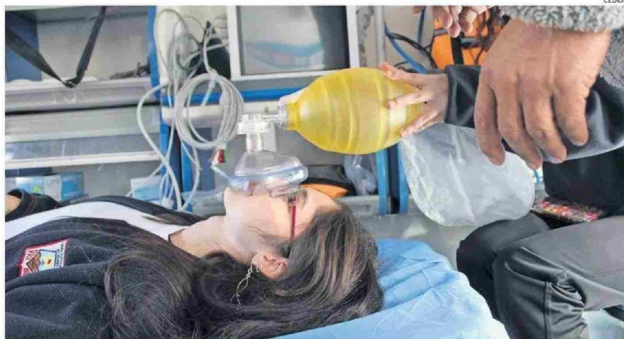
APRENDIERON MANIOBRAS PARA SALVAR VIDAS.