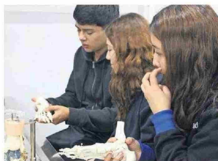
ALUMNOS ENTENDIERON COMPOSICIÓN DE LOS HUESOS.