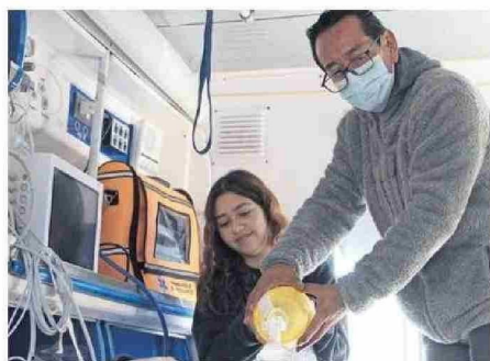
CONOCIERON EL SIMULADOR DE AMBULANCIA.