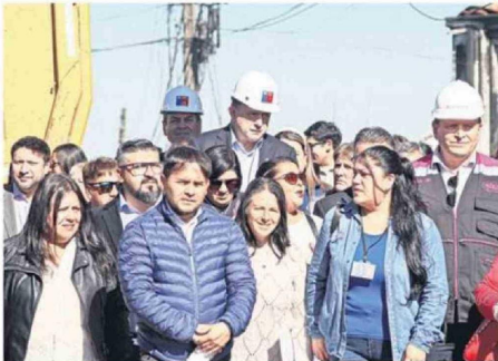
AUTORIDADES Y VECINOS PRESENCIARON EL INICIO DE LAS FAENAS.