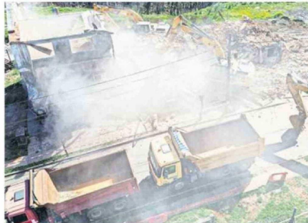
CAMIONES TRASLADARÁN LAS TONELADAS DE ESCOMBROS.