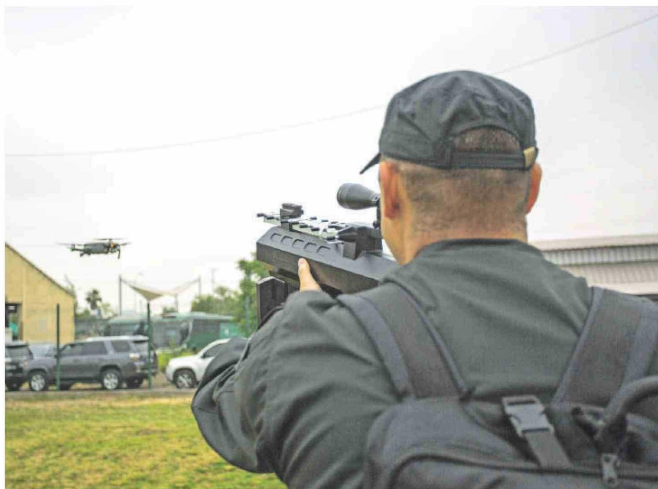
La tecnología, como esta antidrones, será indispensable en el nuevo recinto.

El Repas fue remodelado en 2023, con una inversión de $3.700 millones, para mejorar la infraestructura, seguridad y tecnovigilancia 24/7. Se implementó más luminaria en celdas y pasillos, se aumentó en 65% el número de cámaras (a 387), incorporando algunas térmicas y sistemas de escaneo corporal y antidron automatizado. En Máxima Seguridad las celdas son aisladas y con régimen de tiempo en el exterior en horarios diferidos, para que no haya conversaciones, y las visitas son