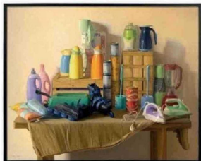
► Parte de la obra del artista