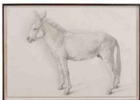
► Como parte de su trabajo, Bravo solía dibujar animales.

difícil, por la desilusión de una persona que yo pensaba que era mi amigo y que me estaba ayudando, pero estaba haciendo esto".