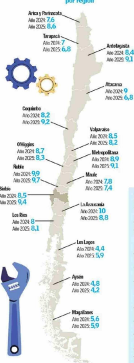
Tasa de desocupación por región

A los datos del INE ya citados asociados al trimestre móvil diciembre 2025-febrero 2026, se suma la reciente publicación del boletín del trimestre enero-marzo 2026, donde se indica que la tasa de desocupación regional creció al 10% y es la más alta a nivel nacional.