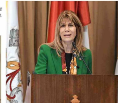
Ministra Rincón durante su intervención.