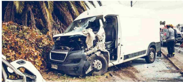
Fue un complejo rescate vehicular que permitió la liberación la persona afectada.