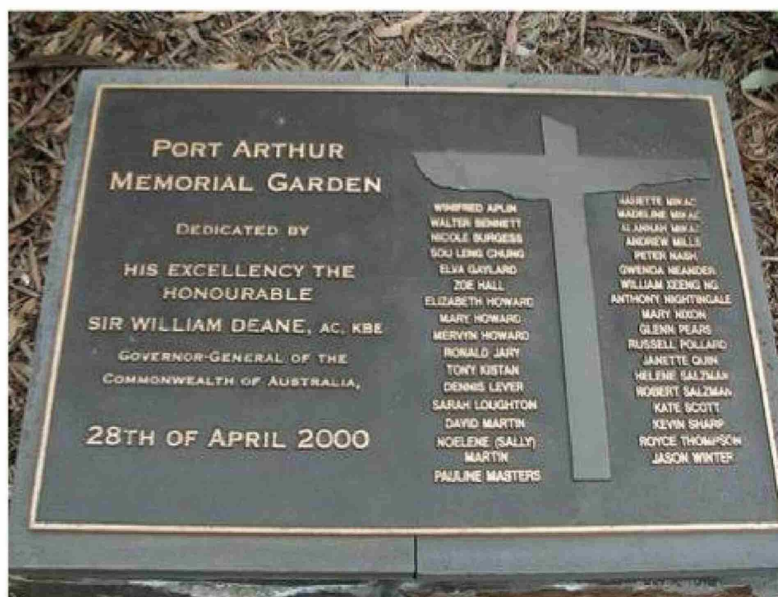
Placa conmemorativa de la masacre con los nombres de las víctimas.

El impacto no fue solo judicial. El 10 de mayo de 1996, apenas doce días después de la tragedia, el gobierno australiano impulsó el Acuerdo Nacional sobre Armas de Fuego. Esta reforma endureció el acceso a las armas, prohibió la tenencia de rifles y escopetas semiautomáticas, y estableció un sistema nacional de registro y licencias mucho más estricto.