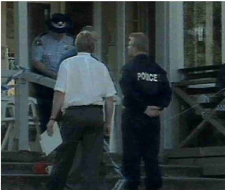
La policía en medio de la masacre.