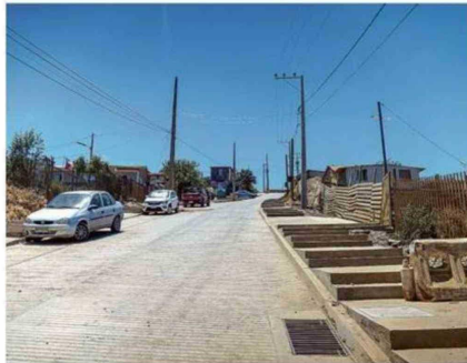
EL PROYECTO PROMETE CALZADAS DE HASTA 7 METROS

En materia de servicios y seguridad, la iniciativa ofrece una solución defini-