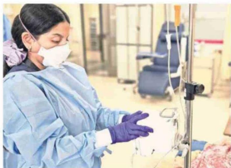
LA APLICACIÓN DE DOSIS SEGURAS ESTÁ LLEGANDO A PACIENTES.

La implementación de esta estrategia ha tenido un impacto directo en las patologías de los pacientes de la zona.