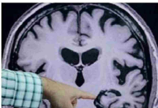
Los expertos indican que un cambio típico y común relacionado con la edad es olvidar ocasionalmente nombres o citas, pero recordarlos después.

olvidar la fecha o la estación del año en la que se encuentran, así como no ser conscientes del paso del tiempo. En ocasiones, también pueden desubicarse y olvidar dónde están o cómo llegaron allí.