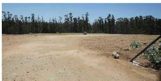
En este terreno del nuevo recinto, ubicado en el Camino Antigua a Punta de Lobos, en zona segura ante ocurrencia de tsunamis.