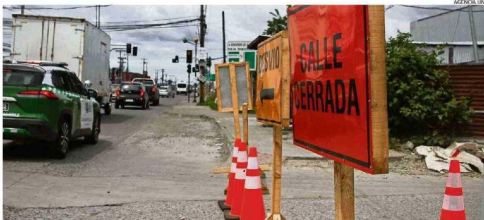
EN EFE EXPLICAN QUE ESTÁN TRABAJANDO EN LA REHABILITACIÓN DE LOS CRUCES FERROVIARIOS.