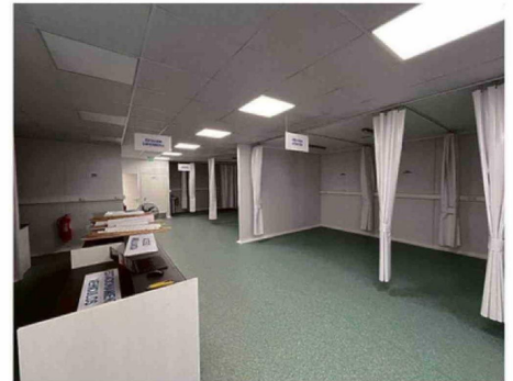
LA INFRAESTRUCTURA ESTÁ LISTA HACE MÁS DE UN AÑO.

A través de una carta pública, la agrupación calificó la situación como un "monumento a la burocracia", señalando que el SAPU debía ser una solución transitoria mientras se construye el futuro Ces-