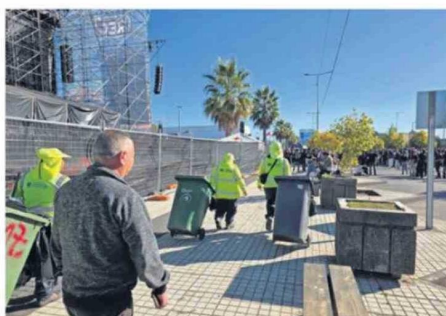
Equipos municipales se encargaron de la limpieza del parque.