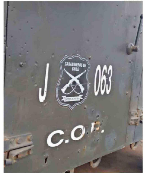
ABOGADA DIJO QUE LA CARABINERA HA SEGUIDO SUFRIENDO HOSTIGAMIENTO.