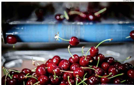
La mala temporada 2024-25 de las cerezas generó un deterioro en la mirada de los bancos sobre el agro.

“Si observas el tipo de cambio, todavía está en un nivel alto y hay un acceso a insumos más baratos que en 2022, lo que es positivo para los agricultores”.