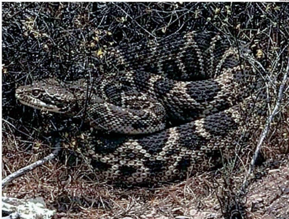
EN UNOS MATORRALES UN VECINO ALCANZÓ A FOTOGRAFIAR A LA SERPIENTE DE CASCABEL.

"Tienen un veneno poderoso sin antidotos en Chile, pero en general su