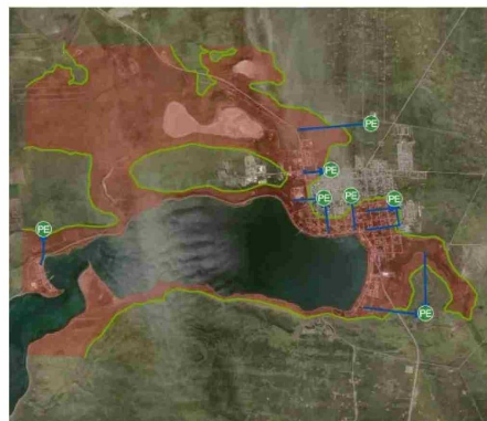
Porvenir cuenta con una zona inundable bastante amplia.

gios y el sector privado es vital para que Magallanes esté realmente preparado ante la fuerza de la naturaleza.