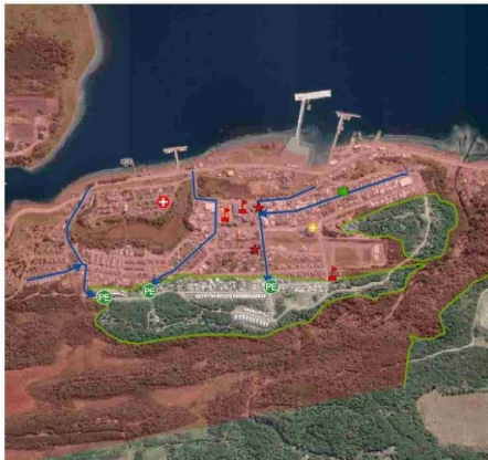
Cabo de Hornos cuenta con una zona inundable prolongada, según el sitio web de Senapred.